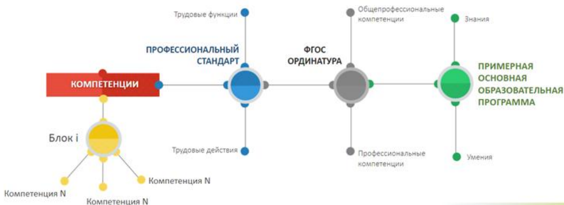
Рисунок 5 - Методология образовательного процесса при подготовке специалиста в области организации здравоохранения и общественного здоровья

На рисунке 5 представлена методология образовательного процесса при подготовке специалиста в области организации здравоохранения и общественного здоровья с учетом требований утвержденного профессионального стандарта 10 .