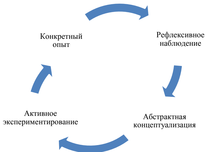
Рисунок 1 - Модель обучения через опыт Дэвида Колба

В процессе освоения модуля «Стажировка» слушатели на основании конкретного примера управленческой деятельности ( конкретный опыт ) оценивают происходящие процессы и обсуждают их в рамках дебрифинга ( рефлексивное наблюдение ), после чего делают выводы и анализируют ситуацию на своих рабочих местах с позиции полученного опыта ( абстрактная концептуализация ), что в дальнейшем может помочь им при разработке необходимых корректирующих мероприятий в медицинских организациях ( активное экспериментирование ).