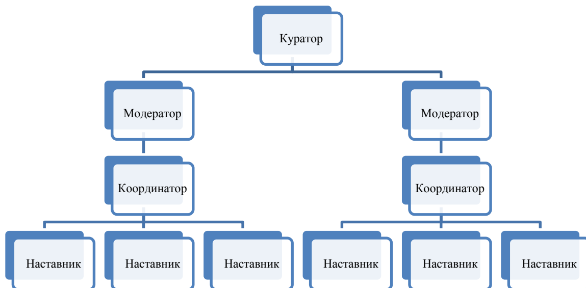
Рисунок 4 – Схема взаимодействия между участниками организации процесса модуля «Стажировка» на клинической базе

Координатором стажировки является сотрудник организации здравоохранения, занимающийся процессом реализации программы модуля «Стажировка» на клинической базе, занимающий одну из руководящих должностей (главный врач, заместители главного врача).